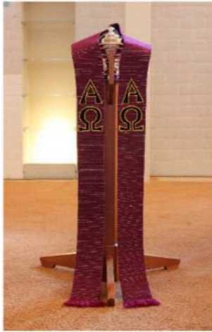
De paarse stola voor de adventstijd en 40dagentijd, met daarop de Alfa en Omega

Paars is de kleur van rouw, boete en ingetogenheid. Want dat Kerstfeest is mooi om te vieren, maar waarom was het nodig dat Jezus op aarde kwam? En in de 40dagentijd is het helemaal duidelijk: we zijn wel op weg naar Pasen, maar dan toch eerst naar Goede Vrijdag. Als het gaat om rouw kan bij een uitvaartdienst de kleur van de antependia dus paars zijn.