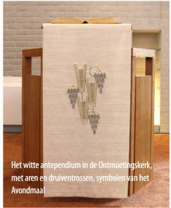
Het witte antependium in de Ontmoetingskerk, met aren en druiventrossen, symbolen van het Avondmaal

En ook al zijn de kleuren eigenlijk al symbool genoeg, een kaal 'kleed' is toch wel erg kaal. Dus werden de antependia versierd met verschillende symbolen.